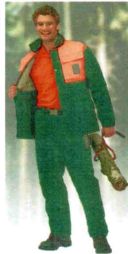
49-301, Form A, Kl. 1