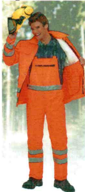
49-303, Form A, Kl. 1