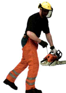
49-260, Form C, Kl.1, Beinling