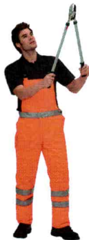
49-221, Form C, Kl.1, LH