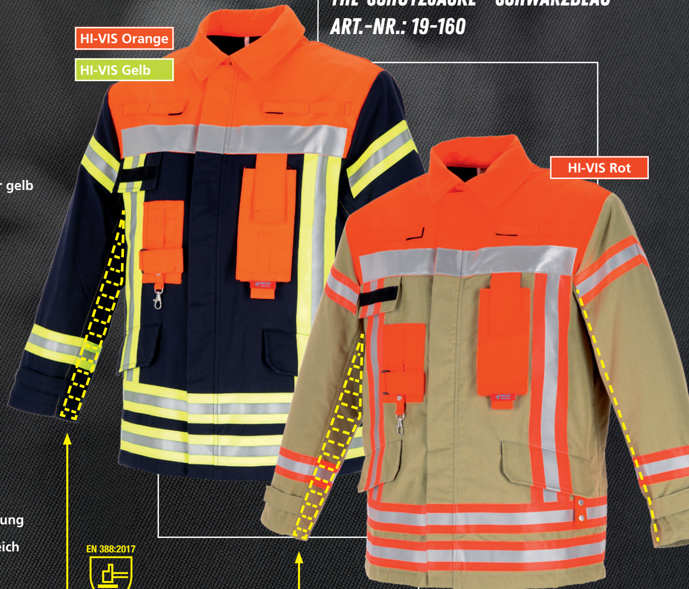
THL-SCHUTZJACKE - SCHWARZBLAU ART.-NR.: 19-160