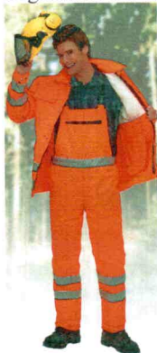
49-304, Form B, Kl. 1