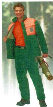
49-302, Form B, Kl. 1